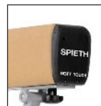
Embouts d'extrémité souples