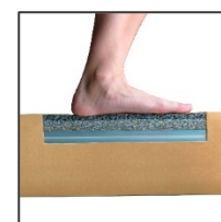
Technologie Soft touch