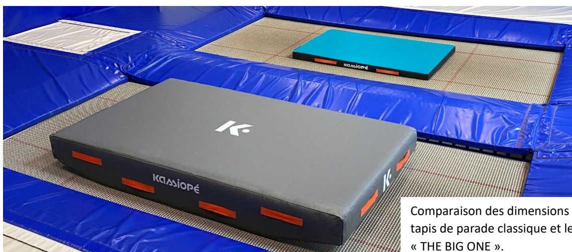
Comparaison des dimensions entre un tapis de parade classique et le tapis XXL « THE BIG ONE ».