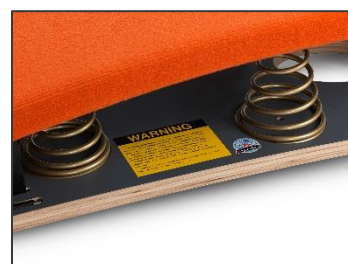
Système de ressort de qualité