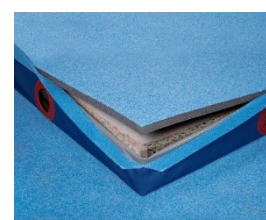
Composition du tapis de réception