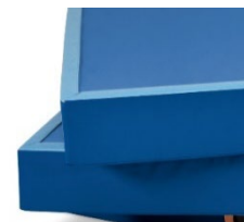
Housse intégrale PVC avec velcros de liaison en périphérie